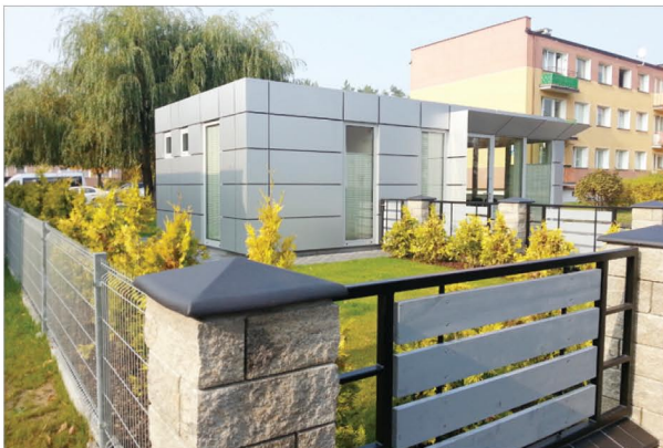
Budynek firmy WMC stanął w miejscu dawnego Domu Leśnika.